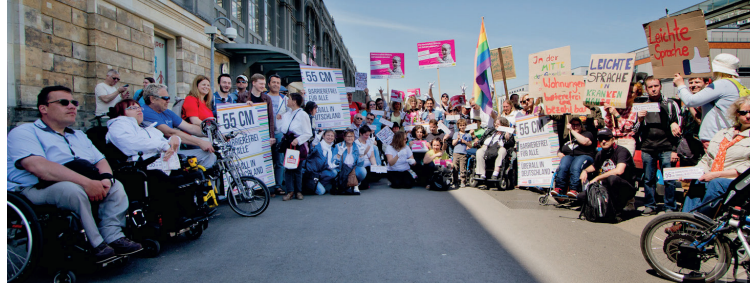
Demonstration am Dresdner Hauptbahnhof für die Umsetzung eines barrierefreien Bahnsteighöhenkonzepts zur Parade der Vielfalt im Mai 2018