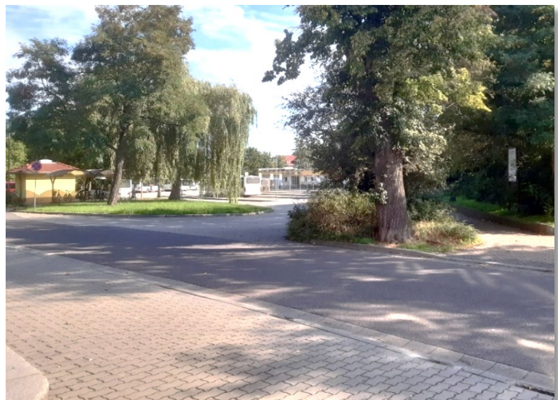
Blick vom Bahnhof über die Bahnhofstraße zum ZOB Borna