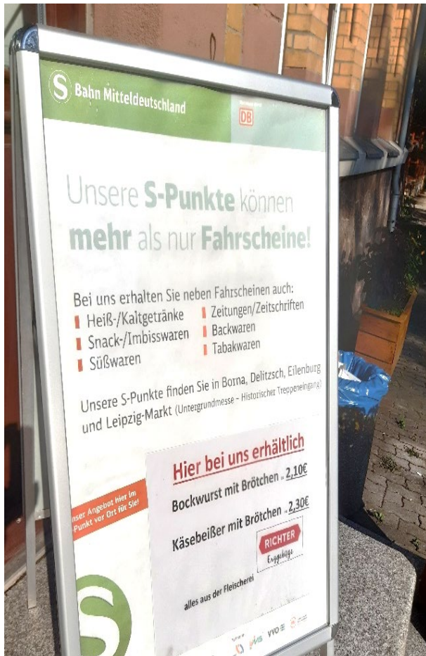
Hinweis auf den S-Punkt im Bahnhofsgebäude

Auch das Bahnhofgebäude wurde saniert und beherbergt neben dem Service-Punkt der DB, kurz „S-Punkt“, ebenso die Büros der DB Regio Ost sowie ein Restaurant. Der S-Punkt ist täglich geöffnet und bietet den Reisenden einen Anlaufpunkt vor Ort. Sowohl der S-Punkt als auch das Restaurant sind von Gleis 1 aus barrierefrei erreichbar.