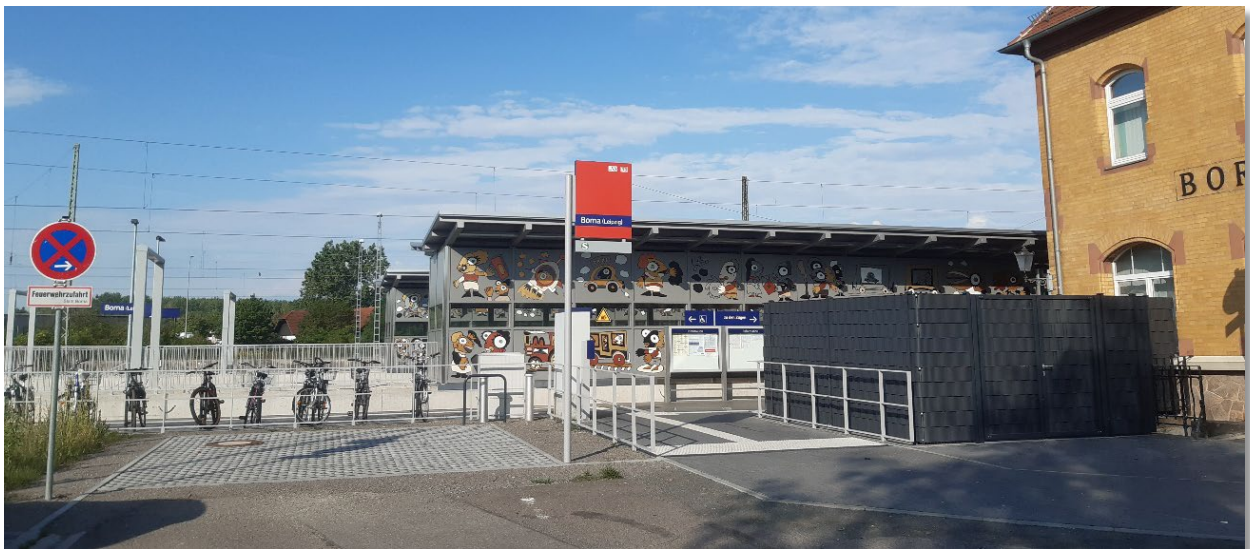
Bahnhof Borna: Zugang zu Gleis 1

(LAG SH/tneu/miwi/kha) In den letzten Jahren war der 1867 eröffnete Bahnhof Borna bei Leipzig stark sanierungsbedürftig. Nun ist er seit Dezember 2022 nach 19 Monaten Bauzeit optisch und technisch wieder auf dem neuesten Stand. Laut einem Artikel von MDR-Online musste die Deutsche Bahn für das 16 Millionen Euro teure Projekt rund 660 Meter Gleis verlegen und zudem mit Materialengpässen sowie sommerlichen Starkregen zurechtkommen.